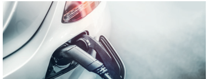
Elektrofahrzeuge als Dienstwagen: Neue Regelungen