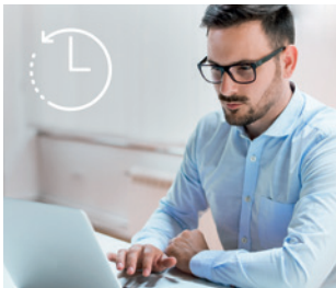
Kurzarbeit und betriebliche Altersvorsorge